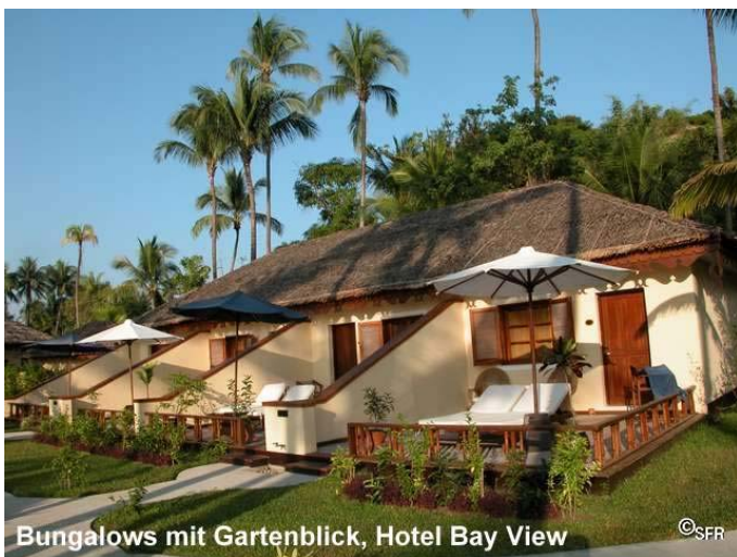
Bungalows mit Gartenblick, Hotel Bay View

erster Reihe (Meerblick) verfügen über geräumige schöne Zimmer mit Klimaanlage, Kühlschrank, Terrasse und werden von unseren Reisegästen bevorzugt; sie sind nur wenige Meter vom Strand entfernt. Außerdem gibt es im Silver Beach-Hotel nette preisgünstige Gartenbungalows (Standard-