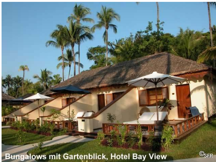
Bungalows mit Gartenblick, Hotel Bay View

verfügen (siehe Foto oben) und eine preisgünstige attraktive Alternative sind, wer auf den Meerblick verzichten möchte (ca. 50 m vom Meer).