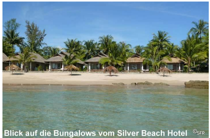
Blick auf die Bungalows vom Silver Beach Hotel

Das Silver Beach Hotel besitzt eine weitläufige Gartenanlage mit einem großen Kokospalmenhain. Die schönen neu gebauten preisgünstigen Junior-Suites in erster Reihe (Meerblick) verfügen über geräumige schöne Zimmer mit Klimaanlage, Kühlschrank, Terrasse und werden von unseren Reisegästen bevorzugt; sie sind nur wenige Meter vom Strand entfernt. Außerdem gibt es im Silver Beach-Hotel nette preisgünstige Gartenbungalows (Standard-Zimmer), die einfacher und kleiner sind, aber über Klimaanlage, Kühlschrank und Terrasse mit Hängematte