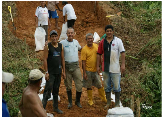
Farm Estrellita Bau eines Fischeiches