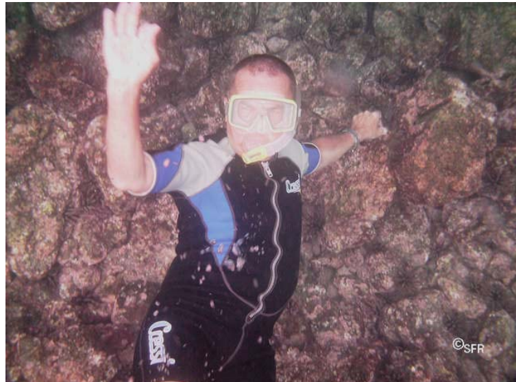
Beim Schnorcheln auf Galapagos